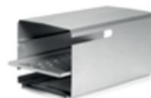
Stacjonarny aluminiowy regał z trzema poziomami