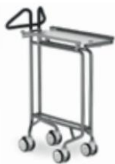
Wózek ułatwiający załadunek/rozładunek