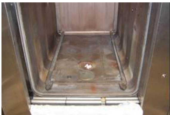
Komora przed czyszczeniem

Wychodząc naprzeciw potrzebom użytkowników oferujemy Państwu usługę czyszczenia komór sterylizatorów.