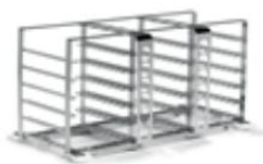
Regał ze stali nierdzewnej na kółkach na 18 kaset (290x190x35 mm)