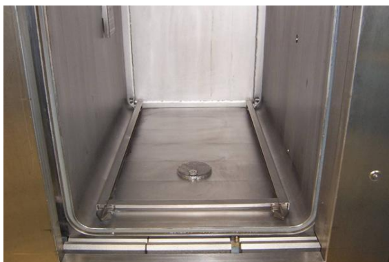
Komora po czyszczeniu