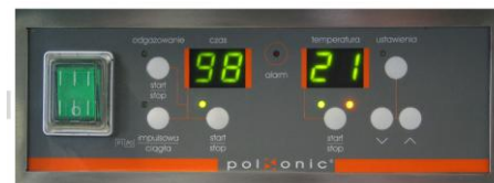
Opcjonalny sterownik mikroprocesorowy